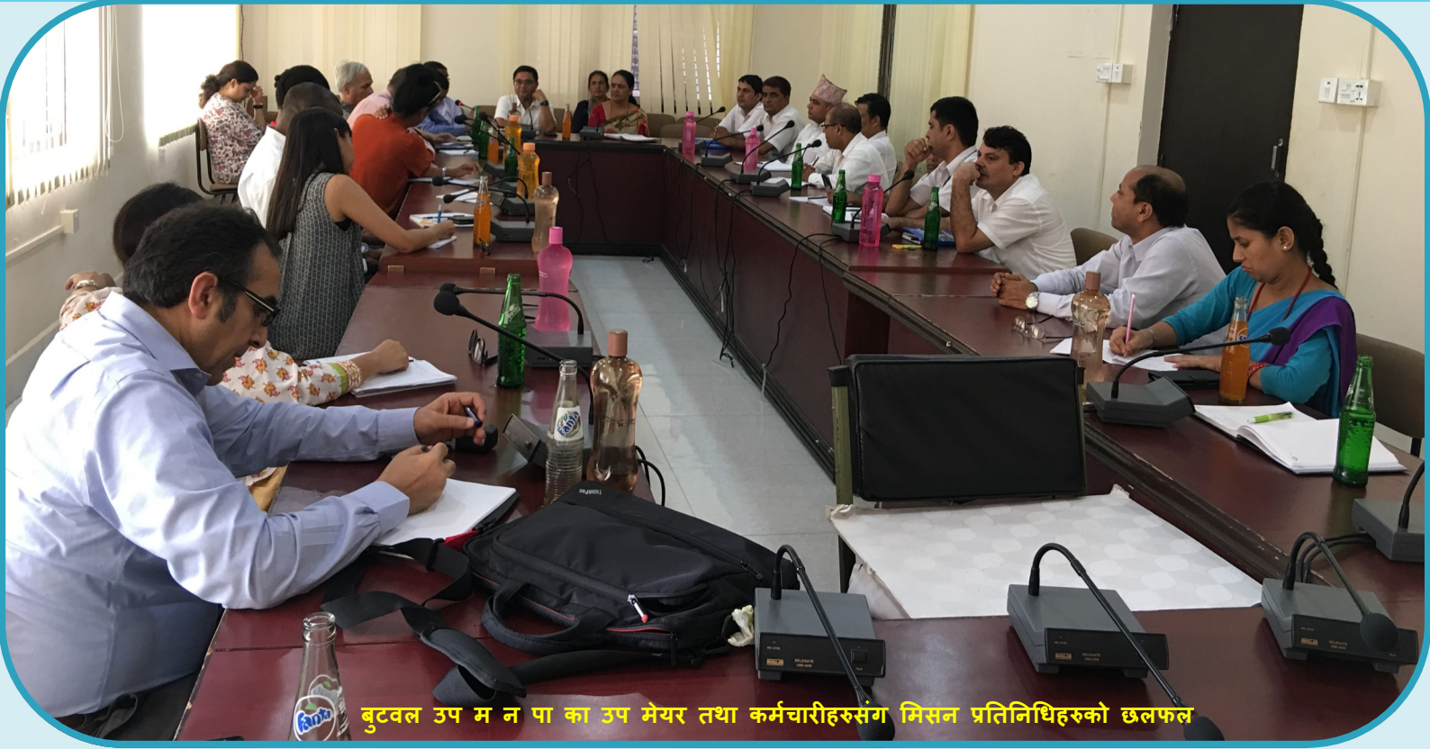
बुटवल उप म न पा का उप मेयर तथा कर्मचारीहरूसंग मिसन प्रतिनिधिहरूको छलफल